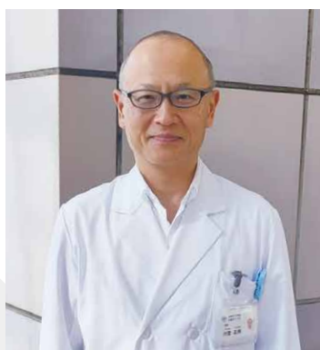
日進クリニック 院長

新たな日進クリニックで、今まで以上に快適な環境の中、 安心の透析医療をお届けします。